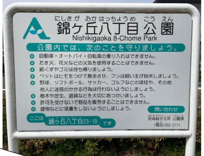
↑ 錦ヶ丘八丁目公園

特に「 野球、ソフトボール、サッカー、ゴルフなどの球技や、その他 他人に迷惑のかかる行為は行わないようにしましょう 」と記されています。