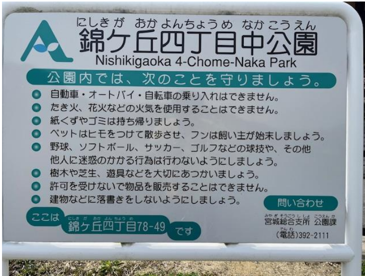
↑ 錦ヶ丘四丁目中公園

午前授業の日の午後や休日に、自宅付近の公園で遊ぶことが多いかと思います。公園の入り口には、下の写真のような、公園のルールが記された看板があります。おそらく看板があることは知っているものの、詳しく読んだことがある人は意外と少ないかもしれません。公園に行った際には、ぜひ一度見てみてください。どのようなスポーツにもルールがあるように、様々な場所・地域・学校・部活動ごとにルールは存在します。ルールを守ることが、皆が気持ちよく生活できることにつながります。大型連休も始まりますので、遊び方を見直してみましょう。